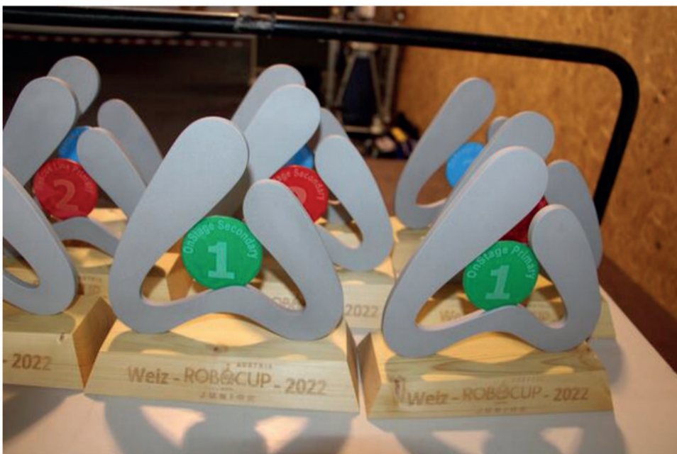
Zuvor hatte man sich schon den Staatsmeistertitel gesichert. Foto: RegionalMedien Steiermark/Hofmüller hochgeladen von Josef Hofmüller

Schon seit 16 Jahren nimmt die HTL Weiz regelmäßig an diesem weltweit größten Wettbewerb für Roboter-Technologie teil. Fünf Weltmeistertitel, zwei Vize-Europameister und dreizehn Staatsmeistertitel wanderten dadurch schon nach Weiz. Der Sieger-Prototyp des Roboters ist übrigens komplett auf einem 3D-Drucker entstanden, ist lebensgroß und kann seinen Oberkörper bewegen.